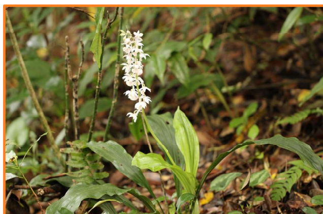
キリシマエビネ (鹿児島市)