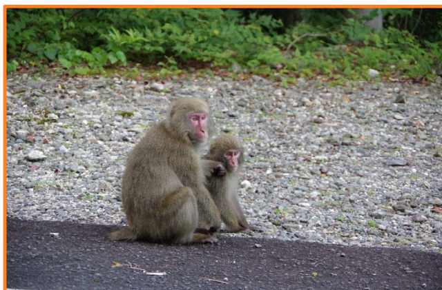
ヤクシマザル (屋久島町)