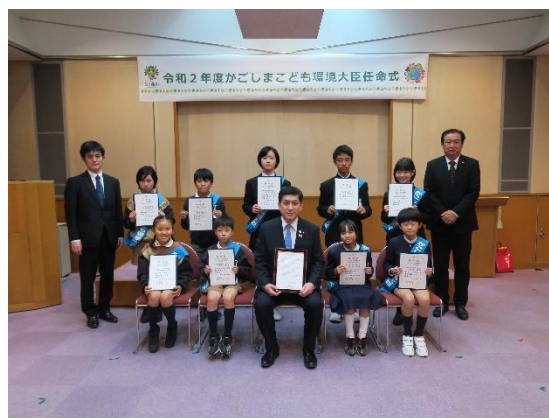
県知事と記念撮影