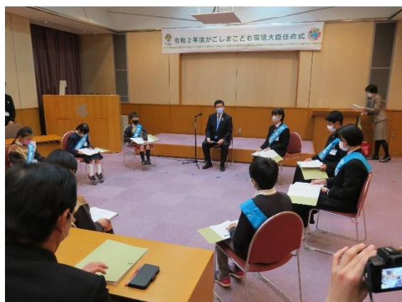
かごしまこども環境大臣サミット