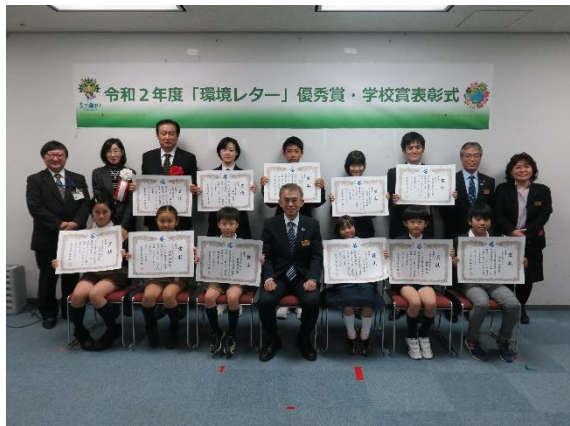
環境レター表彰式