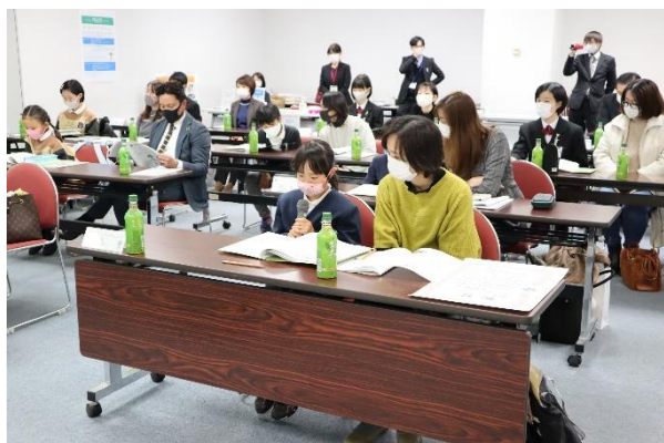
「かごしまこども環境宣言 2020」作り