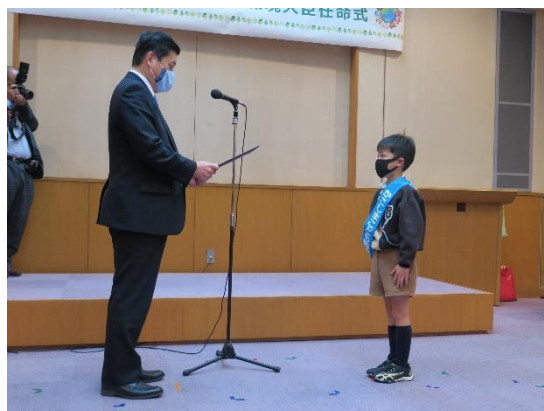
かごしまこども環境大臣 任命式