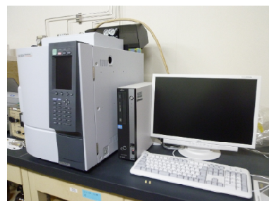
ガスクロマトグラフによる分析