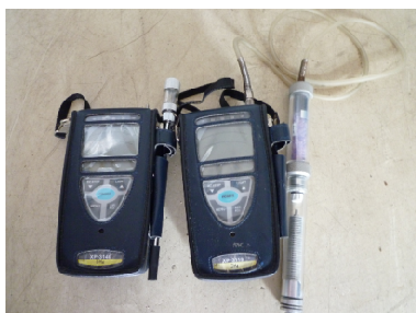
携帯型ガス検知器