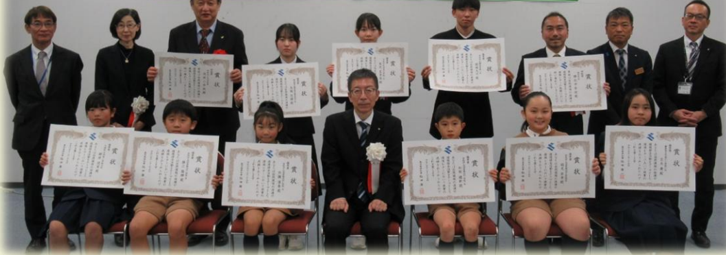
令和6年度「環境レター」優秀賞・学校賞表彰式